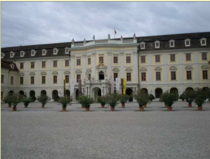
Hinter dem Eingang erwartete uns eine imposante Schlossinnenanlage mit wunderbar gestalteten Räumen...