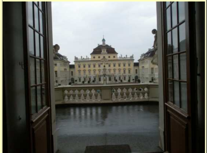
Leider war es im Innern nicht gestattet, mit Blitzlicht zu fotografieren, so dass die Bildausbeute nicht allzu gut war.