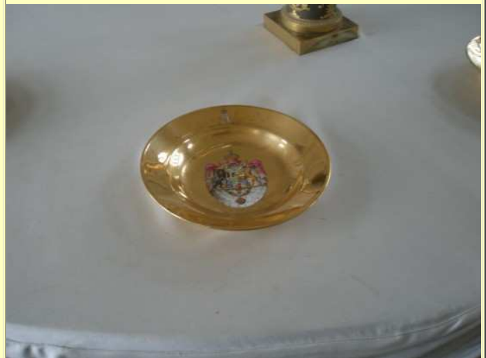
Umgeben ist dieses Schloss von einem 72 ha großen Natur- und Wildpark, wie er eben zu einem Jagdschloss gehört hat. Weit wollte man es ja zur Jagd nicht haben. Und zum Schlafen konnte man ja ins nahe große Schloss gehen. Doch bei der Ausstattung sollte es an nichts fehlen.