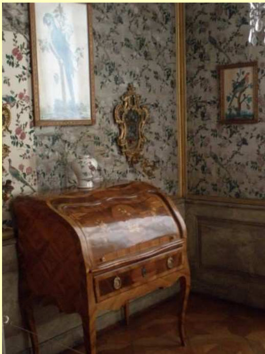
..samt den Ausstattungen mit Tapeten...

Dieses Mal hatten wir einen recht netten und mitteilbaren Führer durch das Schloss, dem man gerne zuhörte.