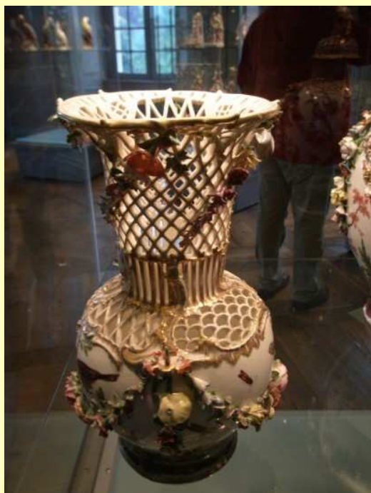
Und natürlich noch vieles mehr, ...