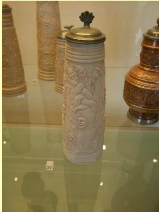
Prunkvase, um 1750-1765