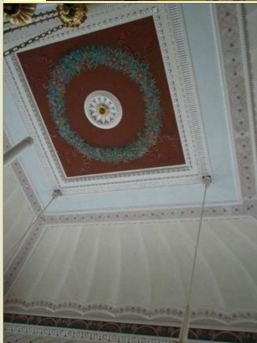
Wirklich schön anzuschauen.